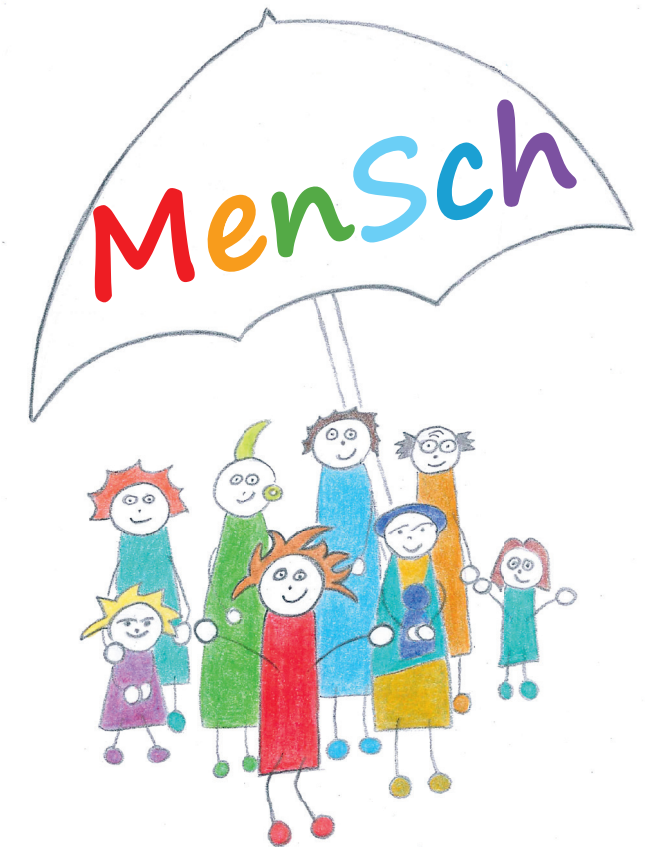
Illustration: ©Inga Sommer

Fachamt Jugend- und Familienhilfe Weidenbaumsweg 21 | CCB Eingang C 21029 Hamburg Tel.: (040) 428 91-35 19 Fax.: (040) 427 90-60 00